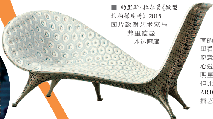
■ 约里斯·拉尔曼《微型结构梯度椅》2015 图片致谢艺术家与弗里德曼 本达画廊

本届展会一个亮点是，今年首次设立“最佳展位奖”“最佳呈现奖”，用以鼓励画廊更加注重展览的策展性、创造性、艺术性，并为获奖画廊提供次年参展1万美元或6000美元的参展费减免，鼓励画廊在视觉设计上更为用心。