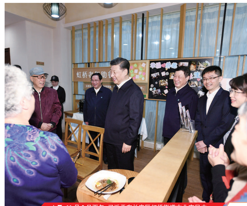
11月2日下午，习近平在长宁区虹桥街道古北市民中心老年助餐点，同正在用餐的居民热情交谈

要试验田，有针对性地进行体制机制创新，强化制度建设，提高经济质量。设立科创板并试点注册制要坚守定位，提高上市公司质量，支持和鼓励“硬科技”企业上市，强化信息披露，合理引导预期，加强监管。长三角三省一市要增强大局意识、全局观念，抓好《长江三角洲区域一体化发展规划纲要》贯彻落实，聚焦重点领域、重点区域、重大项目、重大平台，把一体化发展的文章做好。