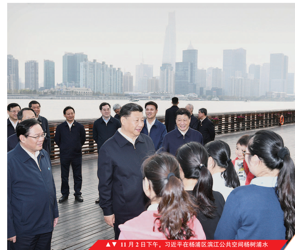
11月2日下午，习近平在杨浦区滨江公共空间杨树浦水厂滨江段，同正在休闲健身的市民亲切交谈

有所应，把群众大大小小的事情办好。要推动城市治理的重心和配套资源向街道社区下沉，聚焦基层党建、城市管理、社区治理和公共服务等主责主业，整合审批、服务、执法等方面力量，面向区域内群众开展服务。要推进服务办理便捷化，优化办事流程，减少办理环节，加快政务信息系统资源整合共享。要推进服务供给精细化，找准服务群众的切入点和着力点，对接群众需求实施服务供给侧改革，办好一件件民生实事。