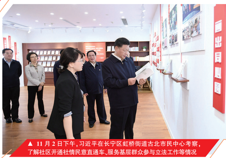
11月2日下午，习近平在长宁区虹桥街道古北市民中心考察，了解社区开通社情民意直通车、服务基层群众参与立法工作等情况

比自豪。习近平鼓励她多向年轻人讲一讲，坚定他们对中国特色社会主义的道路自信、理论自信、制度自信、文化自信。习近平指出，城市是人民的城市，人民城市为人民。无论是城市规划还是城市建设，无论是新城区建设还是老城区改造，都要坚持以人民为中心，聚焦人民群众的需求，合理安排生产、生活、生态空间，走内涵式、集约型、绿色化的高质量发展路子，努力创造宜居、宜乐、宜游的良好环境，让人民有更多获得感，为人民创造更加幸福的美好生活。