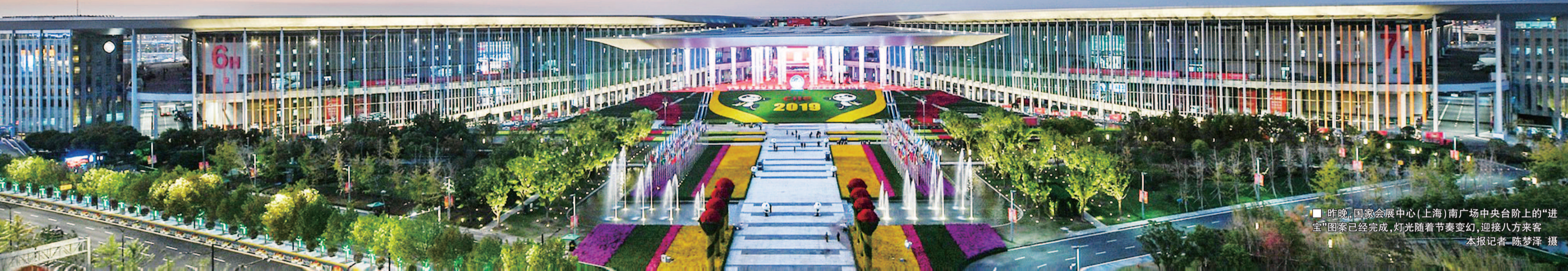
■ 昨晚,国家会展中心(上海)南广场中央台阶上的“进宝”图案已经完成,灯光随着节奏变幻,迎接八方来客

当首届进博会的大幕拉开,“进博人”的脚步却从未停歇。一年间,把展品变成商品的努力中,有他们;筹划“规模更大、质量更高、服务更优、成效更好”的第二届展会,也有他们。一年间,“进博人”结婚了、生娃了,登上了国庆彩车,人生中的欢乐和进取似乎都和进博会有关。这一年,进博会改变了许多人。这一年,“进博人”始终在路上。