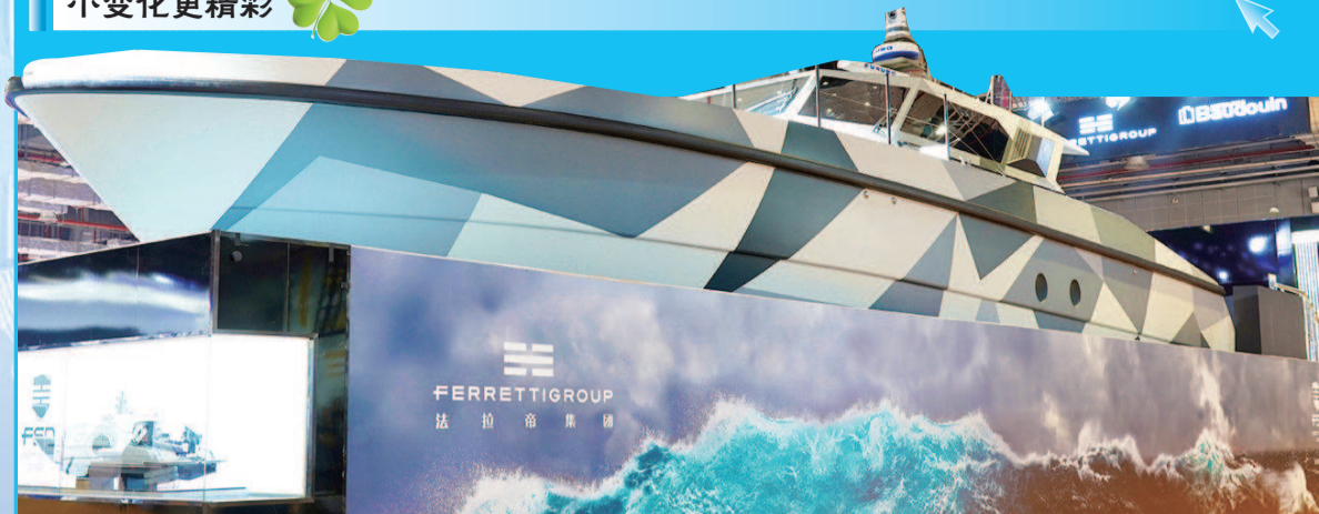
首件进馆展品——来自意大利的法拉帝 195 型高速巡逻船揭开神秘面纱