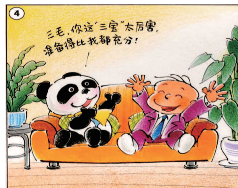
(三毛形象由张乐平家人授权)

第二届进博会明天就要开幕了。三毛作为参会一员,除了花重金定制了一套西装外,还准备了“逛展三宝”。