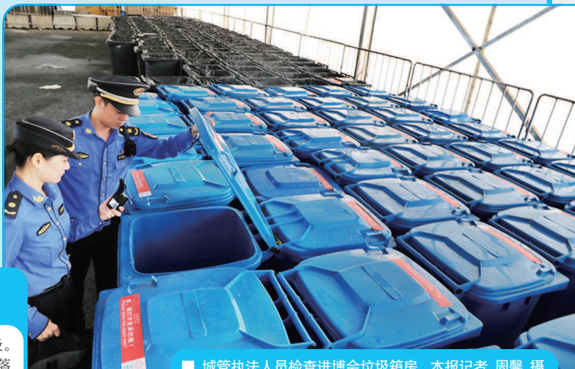
■ 城管执法人员检查进博会垃圾箱房

记者昨天从绿化市容部门获悉，第二届进博场馆及周边区域的垃圾分类投放、收运和应急保洁都已“严阵以待”，作为全国最早启动垃圾分类工作的会展综合体，“四叶草”将成为向全世界宣传“沪版垃圾分类”的平台。