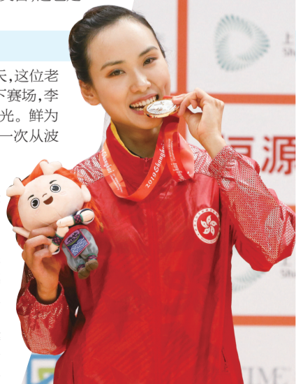
武术世锦赛上的女将魅力四射