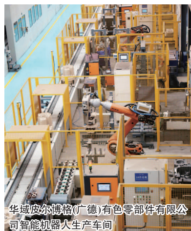
华域皮尔博格(广德)有色零部件有限公司智能机器人生产车间

再看广德的智能装备制造产业，目前已形成了“铸造—机加工—装备制造—下游应用”等相对完整的产业链，在行业内具有一定的竞争优势。