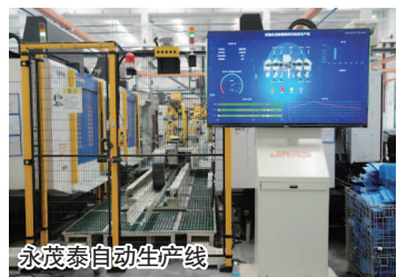
永茂泰自动生产线

目前，广德市共有汽车零部件产业规上企业68家，其中超过九成投资来自长三角地区，已形成以经开区主园、东区为制造中心，北区为检测服务中心的汽车零部件特色产业走廊。广德汽车零部件产业发展“气势如虹”。