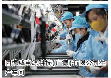
固德威电源科技(广德)有限公司生产车间