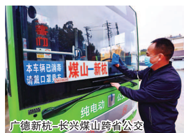
广德新杭—长兴煤山跨省公交

速、溧宁高速等多条国道干线穿境而过，高铁半小时可达杭州。宁杭铁路二通道途经广德，目前正在加紧规划之中，沪苏湖高铁通车后，广德市将正式步入上海“1小时通勤圈”，这也为广德“东向发展、融入长三角”带来了更多前景。