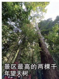
景区最高的两棵千年望天树

落林冠层以望天树为优势形成单优群落。景区范围内生长着近百棵望天树,这是我国至今发现生长最完好的望天树群落之一,同时这里也是中国科学院研究望天树检测考察的基地之一。该景区是西双版纳国家级自然保护区和热带雨林国家公园规划的生态旅游重点建设项目,规划控制面积863.4公顷(包括国家级自然保护区范围150公顷),是一个从水、陆、空全方位观赏并体验热带雨林的大