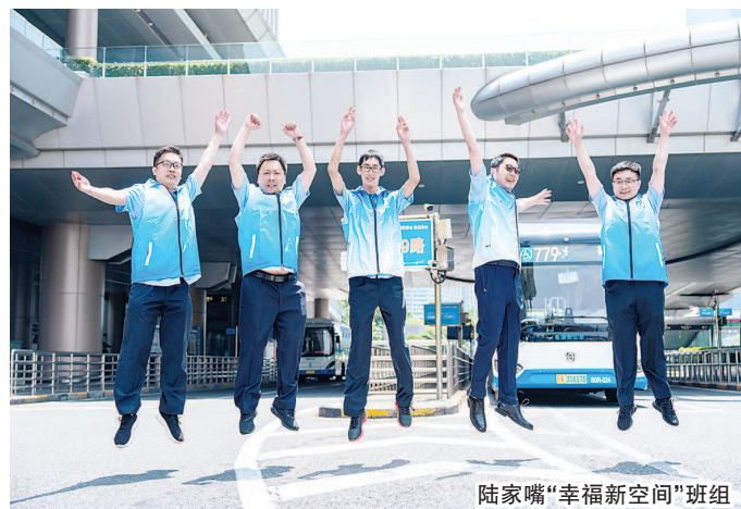
陆家嘴“幸福新空间”班组