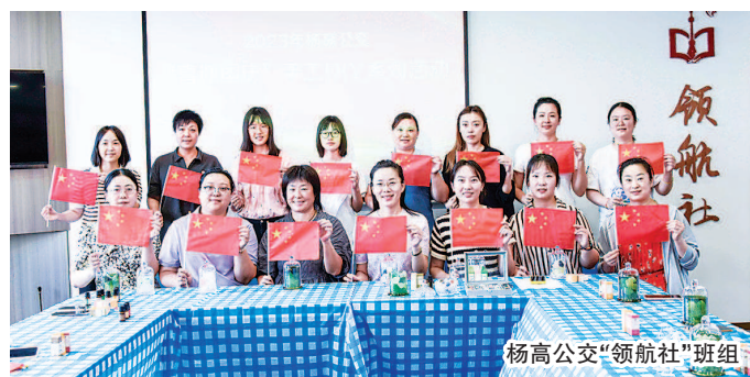
杨高公交“领航社”班组