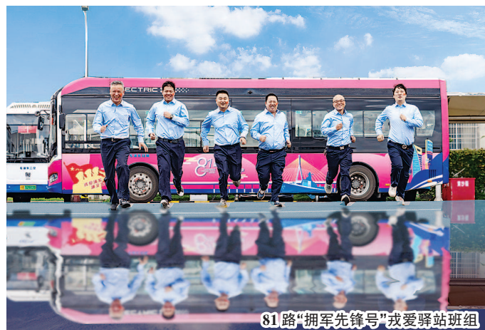
81路“拥军先锋号”戎爱驿站班组