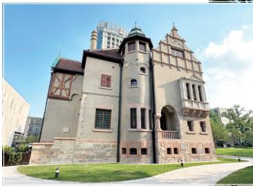
■被评为上海“优秀历史建筑”的德国文艺复兴式花园住宅

于 1956 年定名的上海音乐学院,为文化部直属重点院校,现为文化和旅游部与上海市共建的全日制高等专业音乐(艺术)院校,简称“上音”。位于汾阳路淮海路中的“上音绿地”,沿街可与市民游客直接见面的建筑有“上音歌剧院”和被评为上海“优秀历史建筑”的德国文艺复兴式花园住宅等,绿地内还种植了多种可供观赏的花卉,并贴心地设置了艺术化的休憩座椅。