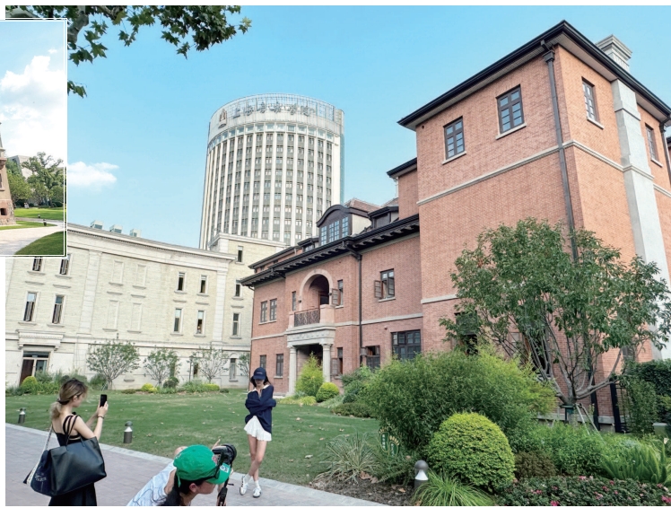
▲位于汾阳路淮海路中的“上音歌剧院” ▲“上音绿地”成为时尚潮人拍摄首选地