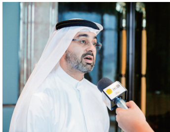
■哈立德阁下接受上海电视台旅游频道采访

继北京站之后,8月30日,沙迦商业及旅游发展局(SCTDA)携多家地接供应商代表转场上海,开启 2023 年沙迦旅游局中国路演的第二站。