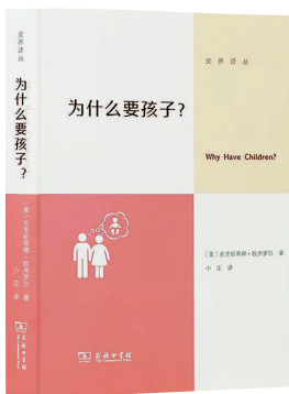
▲《为什么要孩子?》(商务印书馆出版,涵芬楼文化出品)

其二,尽管传统“养儿防老”是国人根深蒂固的生育动因,但在现代社会早已“水土不服”。儒家文化赋予子女赡养老人的道义责任,可城市化带来人口远距离流动,独生子女一代独自背负双方父母养老重担。调研数据显示,当代家庭养老普遍呈现“儿子出钱、女儿出力”的格局,独生子女日常照料缺口尤为明显。对比中外亲子关系