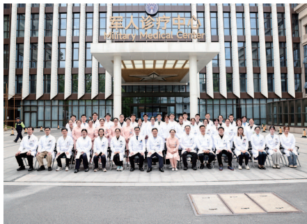
新技术循证研究提供支撑条件。

在此基础上，科室联动院内神经外科、神经内科、脑血管病中心、重症医学科等多学科协同建设，依托卒中中心平台完善脑血管病超早期康复诊疗流程，相关研究成果先后获评中国康复医学科学技术奖一等奖、上海市康复医学科学技术奖一等奖，融合神经调控技术与中医针灸，开展意识障碍康复相关临床研究，借助脑电、近红外检测技术搭建神经调控闭环评估流程。同时科室牵头组建长三角三甲医院康复医学科协作联盟，搭建多中心临床研究与数据管理共享平台，为康复