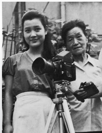
▲上世纪七十年代陈冲与姥姥的合影