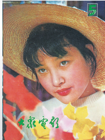
▲当年《大众电影》封面