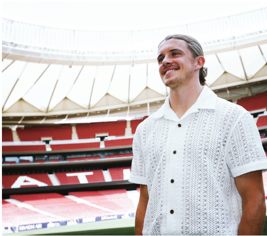
切尔西3500万+3500万欧元报价菲利克斯遭拒绝，因切尔西搞砸了奥莫罗迪翁的交易，这令马竞非常不满，如今加拉格尔的交易也濒临破裂

当然了，可能伯利压根就没考虑这么多，这位美国老板一直在推销让英超向美国职业体育看齐的计划，取消升降级搞南北全明星赛等，如此说来青训报名限制当然也要取消，再说了万一英超联赛又搞起来了呢？你欧足联和英超联盟还能管得了我？