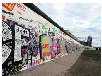
柏林墙遗址纪念公园

和德国作为欧洲地理位置的中心略有不同,作为首都的柏林却处东北一隅,距离和波兰的边境也就70公里左右。但这并不影响柏林作为德国甚至欧洲政治、文化和艺术中心的地位。历史上,柏林在普鲁士王国时期就作为其首都而成为欧洲名城,诞生于17世纪的菩提树下大街,至今还是柏林最有魅力的风景。冷战时期,著名的“柏林墙”将柏林分为东柏林和西柏林,直到1990年东西德合并之后才重新又合二为一。昔日布满涂鸦的墙面,如今只有零星一点可供追忆历史。欧洲杯期间,从自由女神像到勃兰登堡门之间的整条六月十七日大街都将铺上绿色草坪而成为球迷的欢乐天堂。