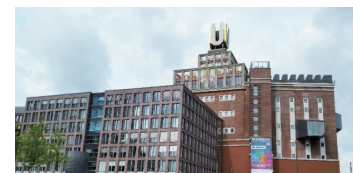
多特蒙德啤酒联盟文化中心

地如今则成为了北威州的“绿色都市”。19世纪下半叶,随着巴伐利亚酿酒技术的引进,多特蒙德的啤酒工艺发展迅猛,早已成为欧洲首屈一指的啤酒之都。