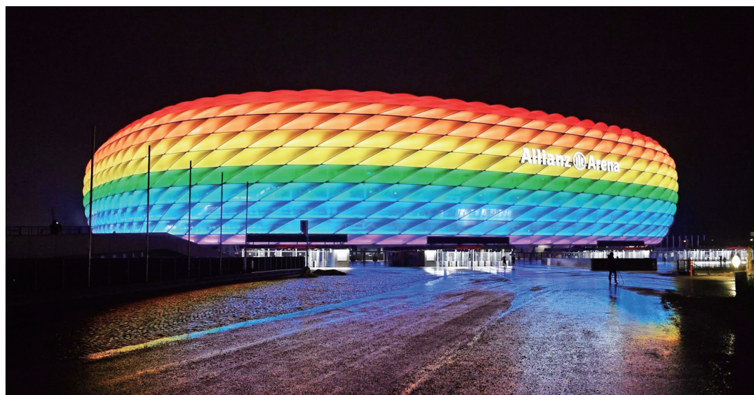
本届欧洲杯将在慕尼黑安联球场拉开大幕