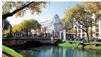
杜塞尔多夫国王大道

年世界杯,但这次欧洲杯终于强势入围。球场名为“水星娱乐竞技场”,是德乙俱乐部杜塞尔多夫的主场,能够容纳47000名观众。