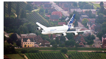
空中客车飞越汉堡市郊

和柏林、不来梅一样,汉堡也是城市州(等同直辖市),位于德国北部,是德国最大的海港以及国际贸易中心,被誉为“德国通往世界的大门”,也是欧洲最富裕的城市之一。汉堡的高端制造发达,是仅次于西雅图的世界第二大飞机制造区,“空中客车”就是从这里飞向全世界。很多方面汉堡和上海都很类似,所以双方结为友好城市再合适不过。