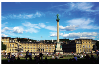
斯图加特王宫广场

“斯图加特”一词,来自于神圣罗马帝国时期的“种马场”。所以,一匹金黄色原野上的黑色骏马就成为了城市的市徽,这也就不难理解,为什么总部位于斯图加特的保时捷汽车的标志是一匹骏马。甚至,法拉利标志上的骏马同样是来自于斯图加特的市徽。作为巴登符腾堡州的州府,斯图加特是德国经济最发达地区之一,除了保时捷之外,最能代表德国汽车和德国制造业的戴姆勒·奔驰以及博世都把总部设在了斯图加特。