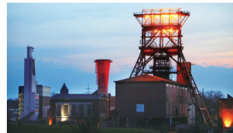
“千火之城”盖尔森基兴

地处鲁尔区的盖尔森基兴,历史并不长,几乎同步于德国的工业革命。鲁尔区的煤炭是德国工业腾飞的支柱,也让盖尔森基兴成为欧洲最重要的采煤城镇,一度号称“千火之城”。对能源的依托已融入到城市的血脉,所以,即便德国的煤铁工业辉煌不再,但盖尔森基兴依然是能源重镇,全德国最大的太阳能发电中心就位于此,也拥有多家规模巨大的火力发电厂。盖尔森基兴的市民多是矿工的后代,所以对足球的爱在很多家族都是代代相传。