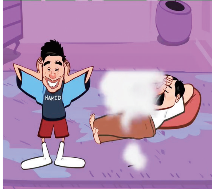
亚马尔的16岁和普通人的16岁, 别人还在叛逆期, 他已经是next level