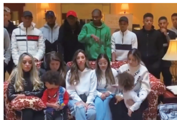
基辅和矿工的巴西外援寻求离开帮助

而说到塞瓦斯托波尔俱乐部，就不得不提目前效力于意甲亚特兰大的乌克兰国脚马利诺夫斯基了，他出自顿涅茨克矿工训练营，2013-2014赛季租借加盟塞瓦斯托波尔，之后三个赛季效力于卢甘斯克黎明，再后出国踢球至今，如今三个老东家里一个已经解散重组，两个流浪在外，怎是一个惨字了得。