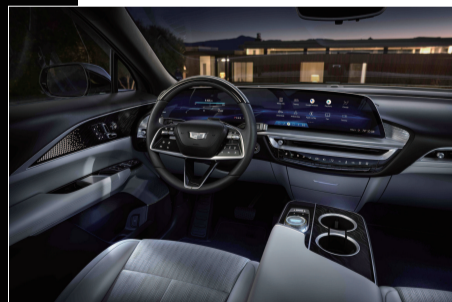
凯迪拉克LYRIQ全系标配33英寸环幕式超视网膜屏，营造出极佳的视觉享受(北美图)

了一块一体式33英寸的对角线OLED大屏幕，从中控台左侧一直延伸至中央靠右，内部结合了组合仪表以及信息娱乐功能，曲面的设计让它看起来非常高级。方向盘采用了木质外加真皮的设计，以凸显豪华感。另外，整体中控台面板和扶手台位置还加入了钢琴烤漆，以及经过切割后拥有更多细节的铝材，凸显了高级感。