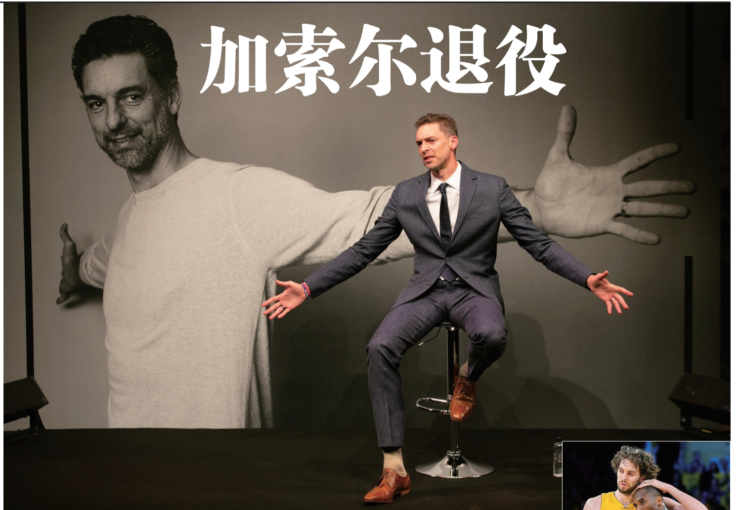
加索尔退役发布会

虽然加索尔的个人数据和表现一路上扬，但灰熊队的成绩并没有如人们预期般攀升。2008年2月1日，加索尔的人生轨迹因为一笔交易而发生改变。洛杉矶湖人队通过交易从灰熊队换来了这位全明星球员，彼时的紫金军团随着拜纳姆的成长，在科比的带领下，已经逐渐走出了低谷，但直到加索尔的到来，才让这支球队跻身总冠