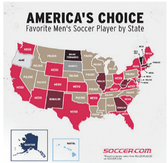
美国足球线上商城soccer.com公布了美国各州销量最高的球衣，本土球星普利西奇和梅西最受欢迎