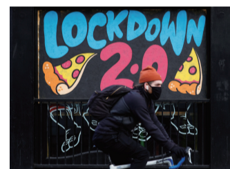
曼彻斯特一家关闭的比萨店窗口画着“第二次禁足”字样的图案

实际上,在英国首相发表电视讲话前,该国已经有一部分体育机构提前暂停了赛事与活动。比如,英国拳击管理委员会于1月3日就叫停了该组织旗下本月全部的比赛和活动。