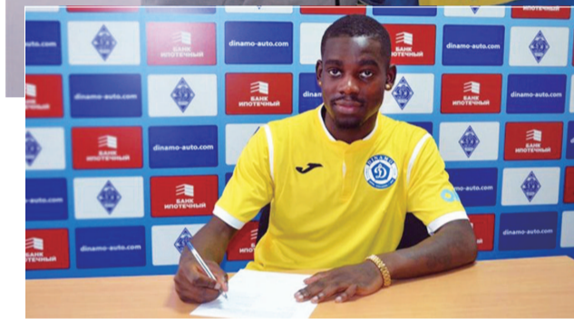
维哈根先后与自动迪纳摩队(左图)以及开普敦队(上图)签约