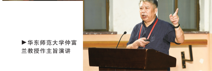
华东师范大学仲富兰教授作主旨演讲