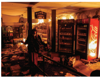
被打砸抢烧的店铺