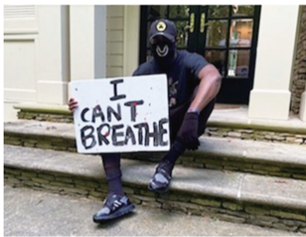
杰伦·布朗回家乡抗议