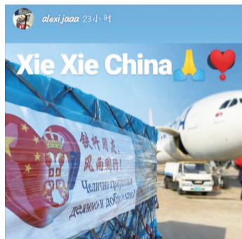
克兰切维奇感谢中国