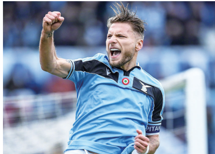
拉齐奥前锋因莫比莱最近状态“爆红”

本场比赛初盘切尔西让一球100水,即时让半/一99水,以两队实力看切尔西初盘让一球有点过分,即时让半/一也摆脱不了庄家诱上的嫌疑,估计临场主队还会降盘让半球。以切尔西最近状态和主场表现看本场比赛拿下阿森纳难度很大,阿森纳自阿尔科塔上任后球队已走向正轨,防守也好很多,本场比赛阿森纳完全有拿分的可能,看好阿森纳受让赢盘。