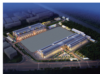
未来的手拉手汽车港