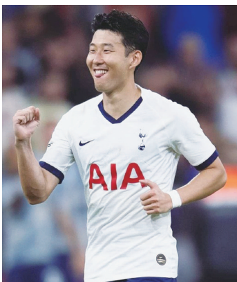
孙兴慜进球值得追捧

本场比赛初盘热刺让一球/球半97水，即时让一球/球半91水，从盘口看热刺客场0比3输给布赖顿被庄家忽视了，庄家更倾向于热刺大胜复仇，热刺现在的状态和两个月前不可同日而语，球队士气高昂又焕发了风采，布赖顿这边攻击力太弱，很难给热刺制造威胁，本场比赛焦点就是热刺赢几个球，看好热刺赢两球以上赢球赢盘。