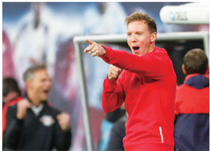
朱利安·纳格尔斯曼麾下的莱比锡是一支朝气蓬勃的球队

本场比赛初盘初盘切尔西让半球105水,即时让半球100水,如果参照10月24日阿贾克斯主场对阵切尔西让平/半的盘口,本场比赛切尔西也应该让阿贾克斯平/半才对,现在切尔西让