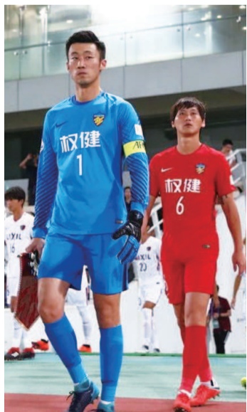
转会还算留队,球员陷入两难

有意思的是,就在昨天,有媒体曝出消息称,腾讯公司正在与天津体育局商谈接手球队的可能性,但这样的报道缺乏事实依据。对于权健球迷而言,自是希望球队能够找个财大气粗的下家,但目前看来,这样的期盼很难成为现实,命运并没有在俱乐部自己的手中。